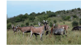
Ziegenbeweidung am Drachenschwanz (PG 7)

Soweit erforderlich, werden die genannten Maßnahmen durch Flächenankäufe unterstützt und gesichert. Durch gut abgestimmte Pflege- und Entwicklungspläne soll ein nachhaltiger Fördermitteleinsatz gewährleistet werden.