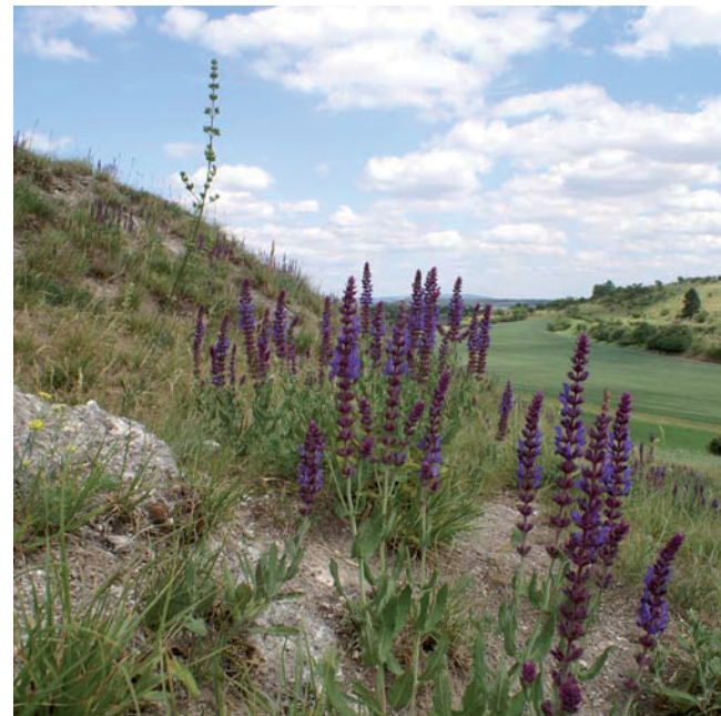
Steppensalbei ( Salvia nemorosa ) am Kippelhorn bei Erfurt (PG 9)

Ziel des Projektes ist die Aufwertung, Erweiterung und langfristige Sicherung der Steppenrasen. Sie beherbergen eine Vielzahl seltener und gefährdeter Arten, deren Erhalt von europaweiter Bedeutung ist.