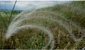
Großes Federgras ( Stipa pulcherrima )