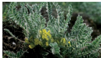
Stängelloser Tragant ( Astragalus exscapus ) – eine Steppenreliktart