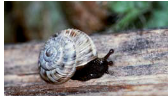
Zwerg-Heideschnecke ( Xerocrassa geyeri )