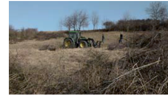
Landschaftspflegearbeiten bei Auerstedt (PG 14)