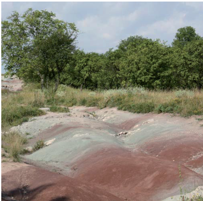
Keuper-Badlands im NSG Schwellenburg nordwestlich von Erfurt (PG 9)

Die Steppenrasen sind sehr oft mit submediterranen, orchideenreichen Kalkmagerrasen und Kalkpionierfluren verzahnt. Im NSG Bottendorfer Hügel sind sie auch in der Nachbarschaft von Schwermetallrasen anzutreffen.