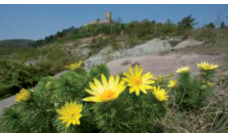
Frühlings-Adonisröschen ( Adonis vernalis )