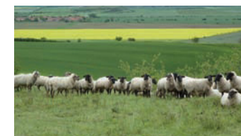
Schafherde auf der Westlichen Schmücke (PG 3)